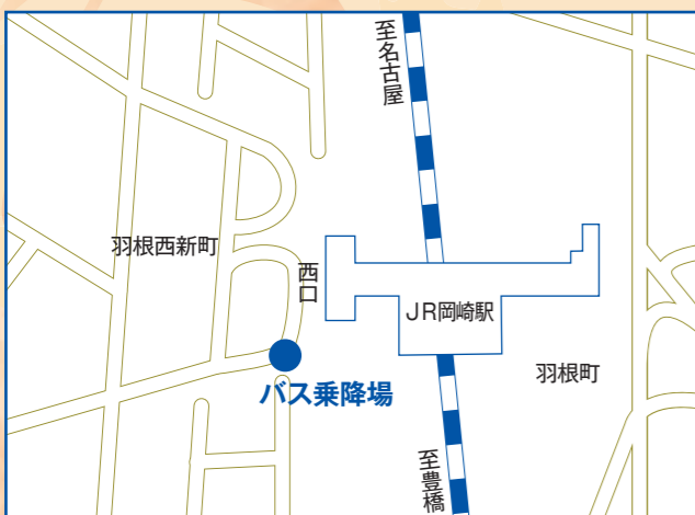
JR 岡崎駅西口(会場までの所要時間約 20 分)

帰り JR岡崎駅・名鉄東岡崎駅=10:15ごろ～12:30まで約20～30分間隔で随時運行します。